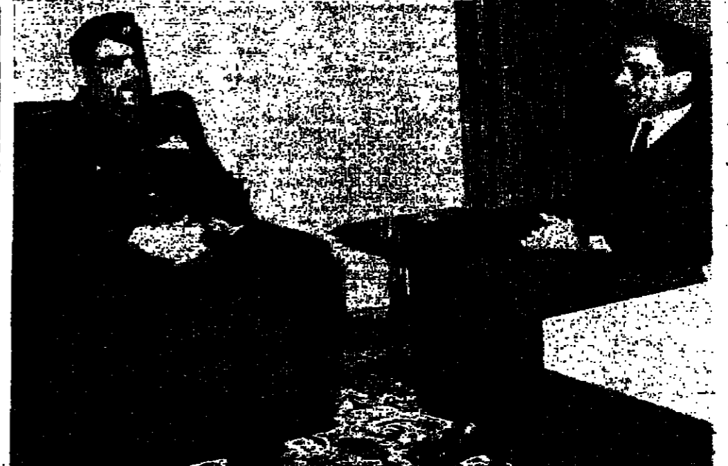
جلالة الملك العظيم اثناء تشرعه للادوار المكن ابراهيم فيصل الانصاري رئيس اركان الجيش العراقي باقتبلة الملكة

عمان - يبدأ البنك المركزي والبنوك الأخرى في المملكة في التعامل بالعملة الذهبية كالتعامل اعتباراً من اليوم (الثلاثاء) بعد توقف أسبوع منذ يوم السبت الماضي . وقد صرح بذلك أمس الدكتور خليل السالم محافظ البنك المركزي ووكالة الأنباء الأردنية . وأضاف ان الاجراءات التي اتخذتها سبعة مصارف مركزية غربية بشأن أزمة الذهب الدولية تهدف الى تلبية طلبات السلطات اقلية من الذهب والى تنمية التجارة الدولية واستقرار اسعار العملات الأجنبية ، كما تهدف الى الجبولة دون المضاربة في اسعار الذهب . واعرب الدكتور السالم عن امله في أن يحصل التعاون الثمر بين السلطات اقلية في العالم في سبيل تحقيق اهداف هذه الاجراءات .